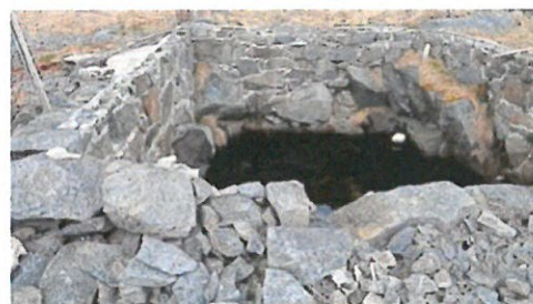
Statsbrønnen på Hundholman.

Formålet er ikke å verne mest mulig, men å skape økt bevisstgjøring og ta vare på et representativt utvalg kulturminner som er særlig viktig for Værøy.