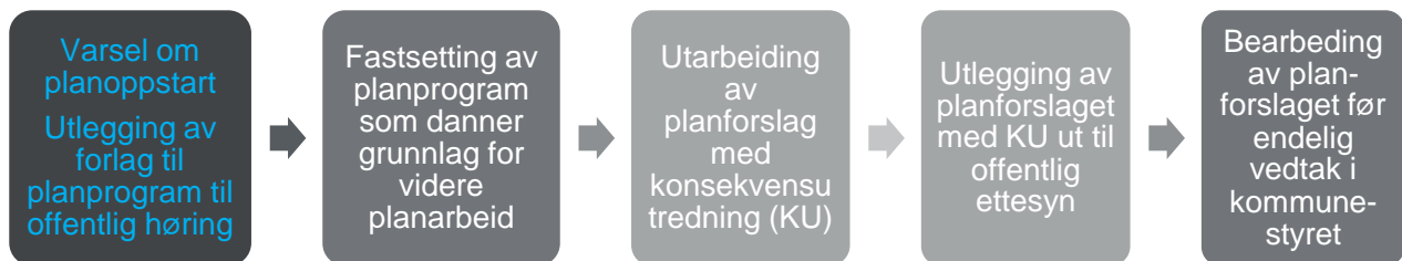
Figur 2. Flytskjema for planprosess med konsekvensutredning (boks med blå skrift viser hvor vi er i prosessen)

Nedenfor følger flytskjema som viser tenkt prosessforløp for planarbeidet.